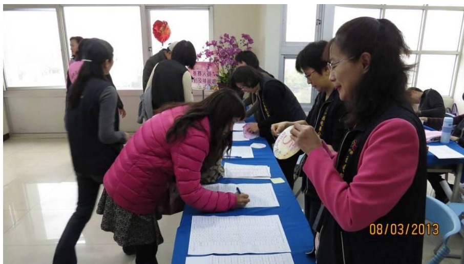
各隊報到與抽籤情形(2)