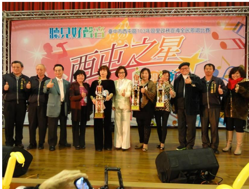
評審團與區長合影