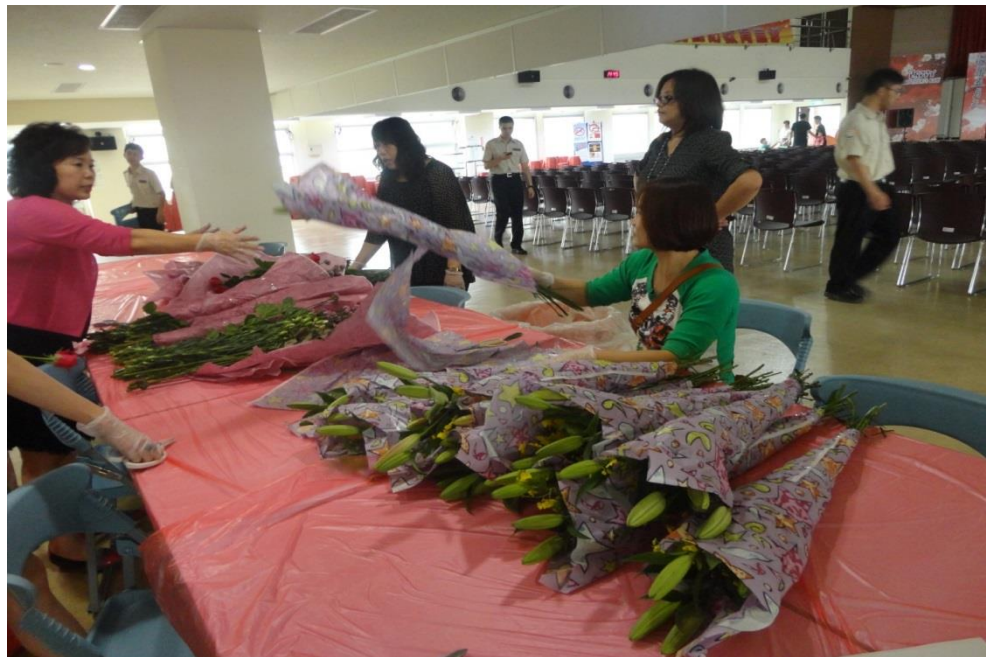
模範母親感恩花束花材準備情形