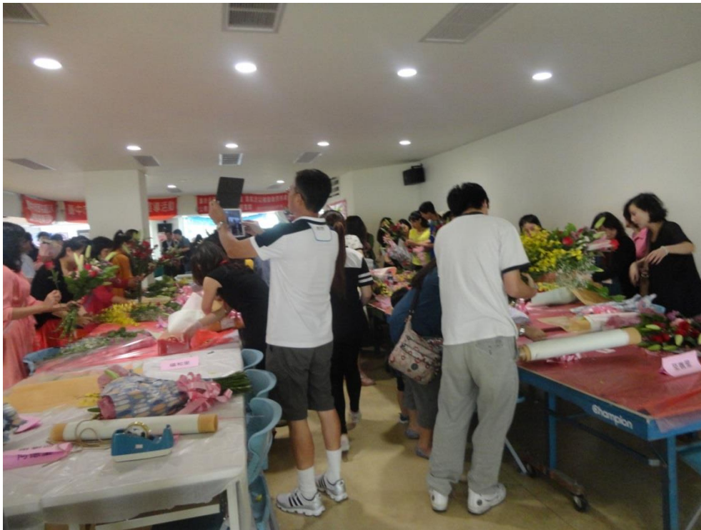
模範母親家屬感恩花束製作情形