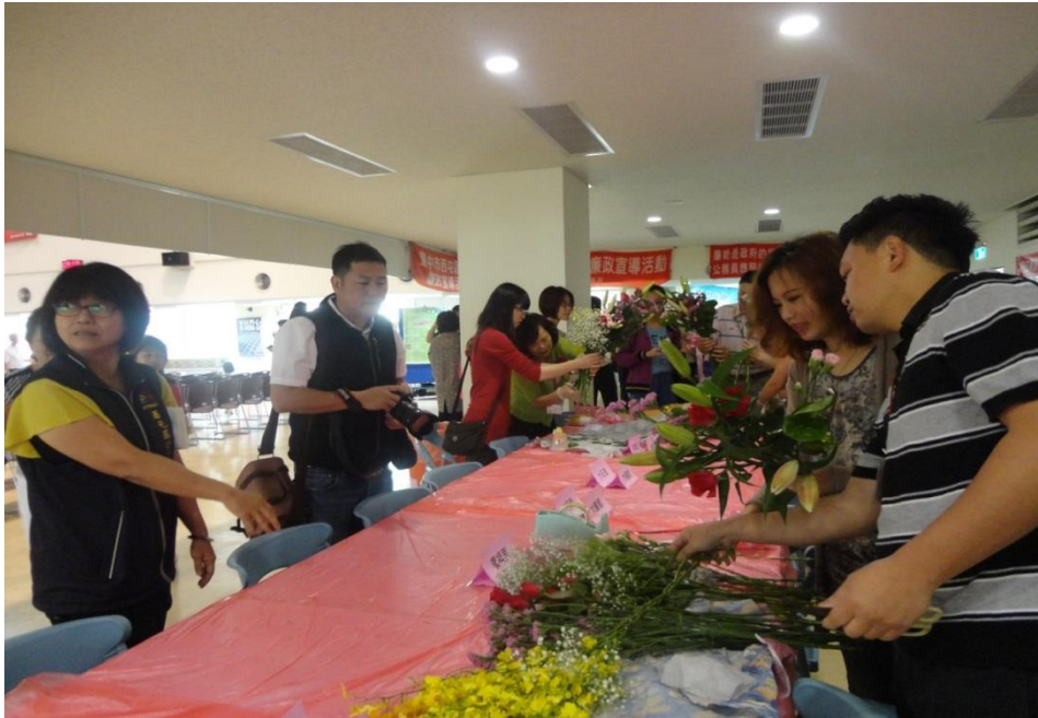
模範母親家屬感恩花束製作情形