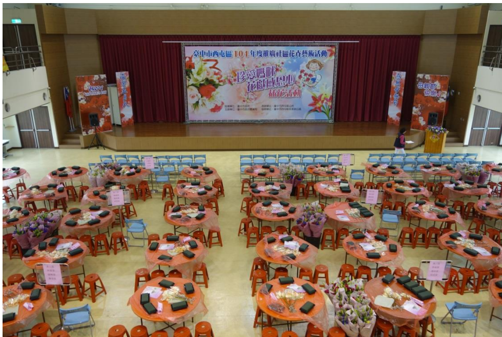
插花活動準備情形