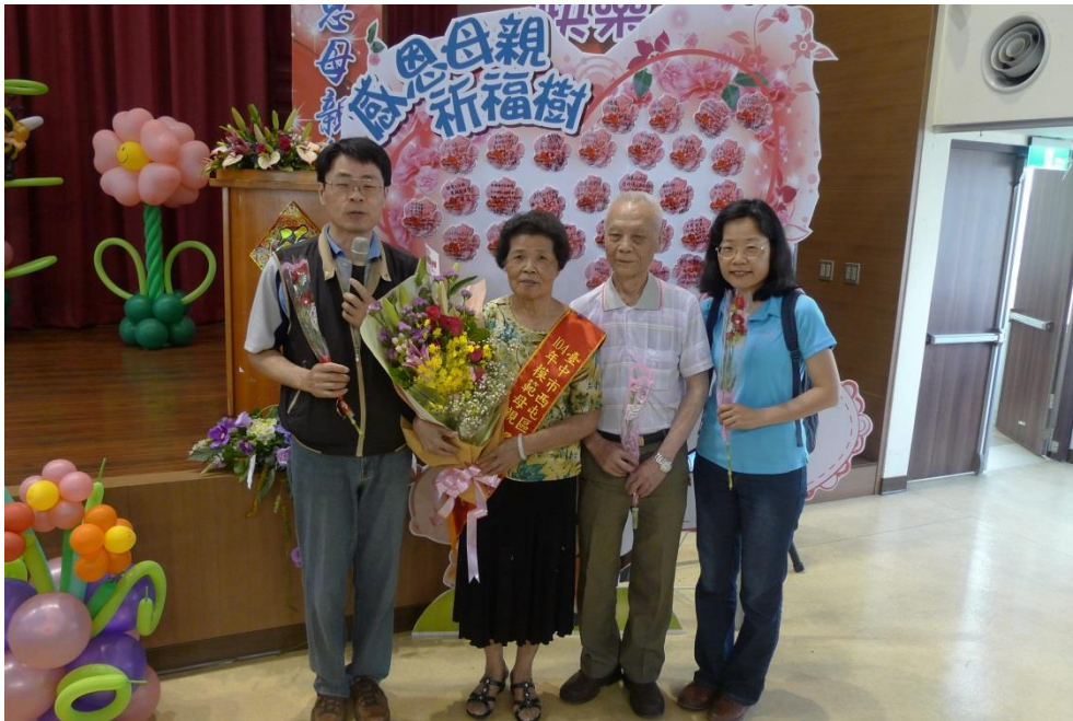
模範母親家屬獻上感恩花束合影