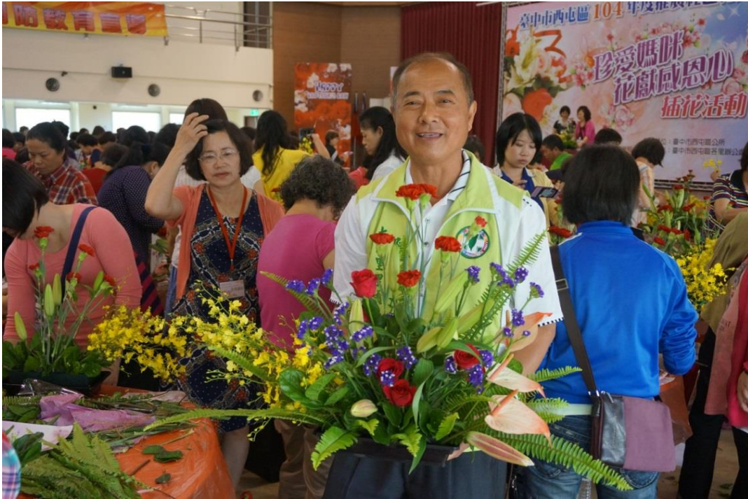
民眾與插花作品合影