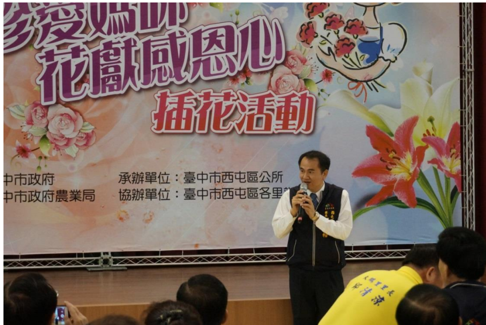
臺中市政府農業局黃簡任技正致詞