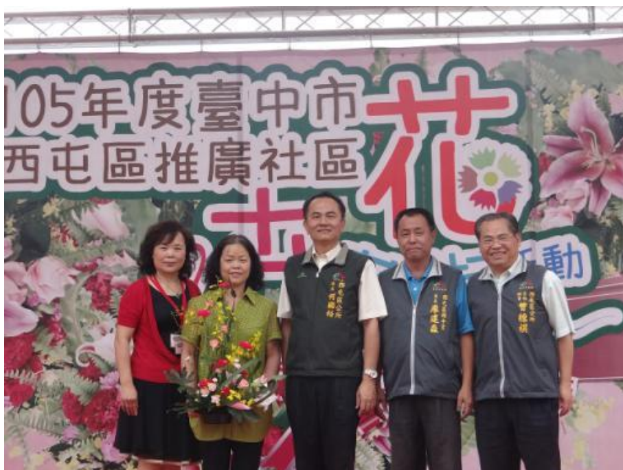
花藝比賽頒獎－優勝