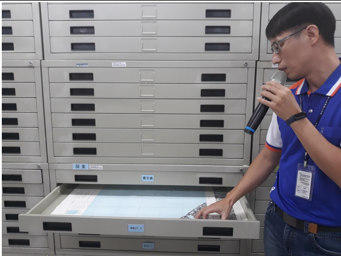
大型附件依檔案類型平放於各層鐵櫃中