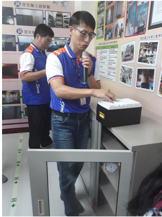
電子媒體類檔案以直立放置，並放置通過認證的去酸盒中