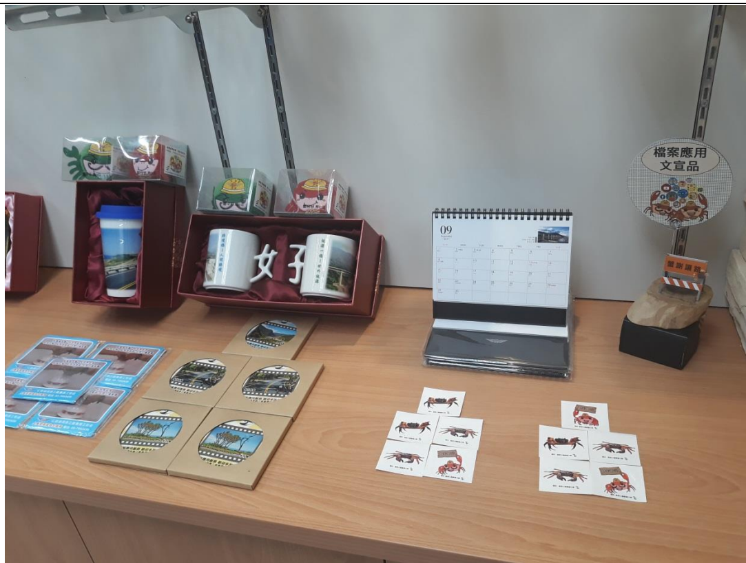
設計多樣檔案應用文宣，有效推廣機關特色