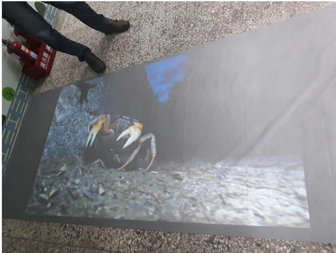
自製影片並投影至地面，讓檔案室外走廊變得生動活潑