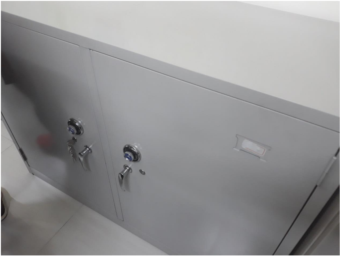
密件置於大型密件櫃中，並設置密碼鎖保存