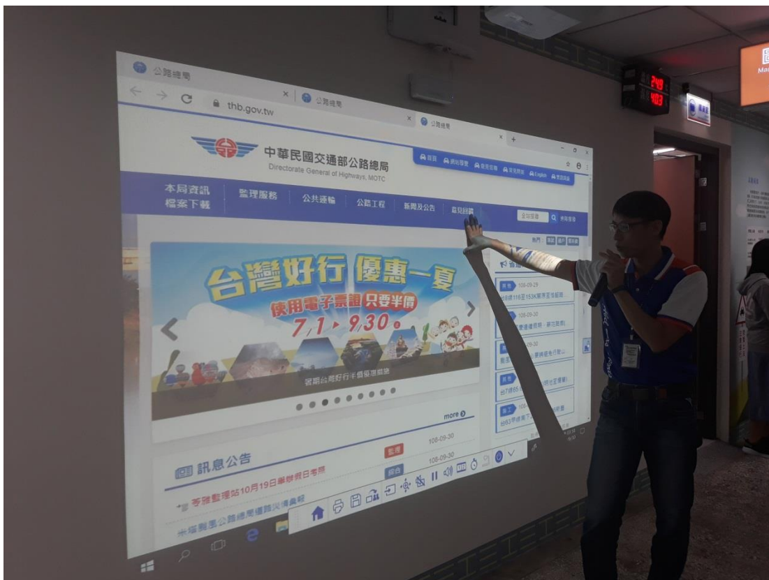
利用大型投影機將機關網頁投影到牆面上，並可進行觸控點選，深具創意。