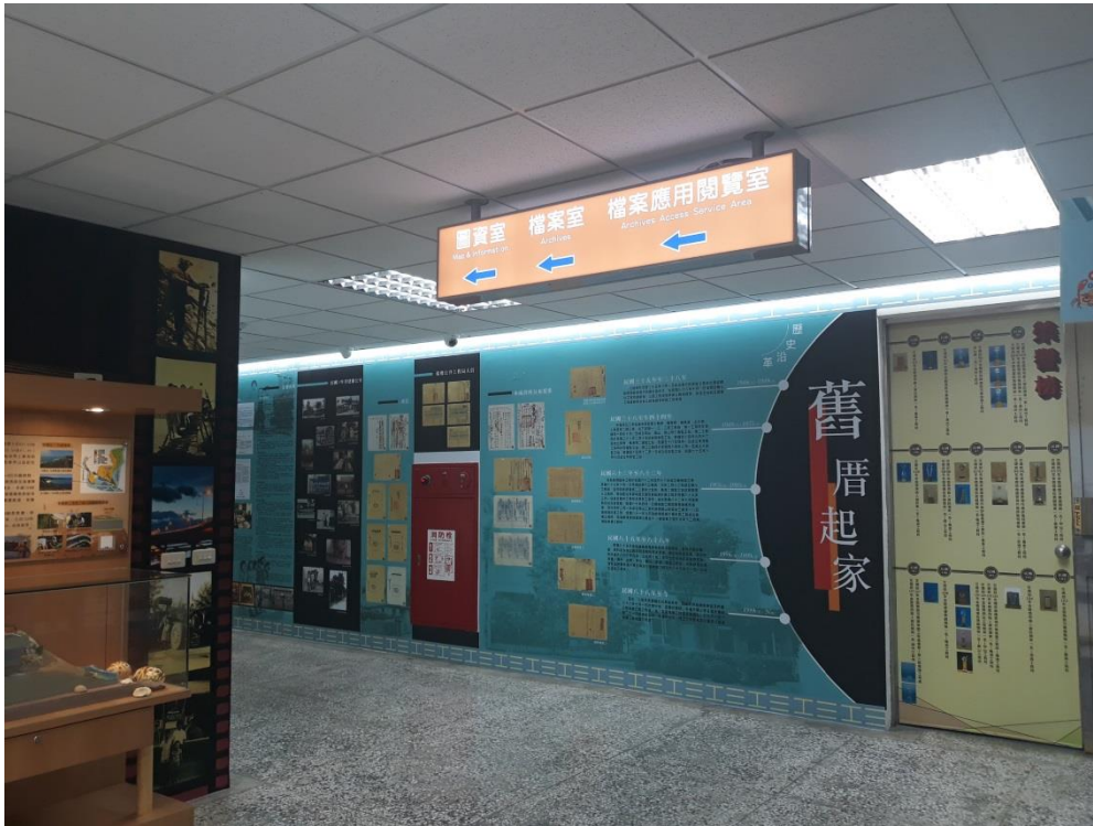
於檔案室外走廊牆面，張貼大型檔案應用海報，介紹檔案歷史