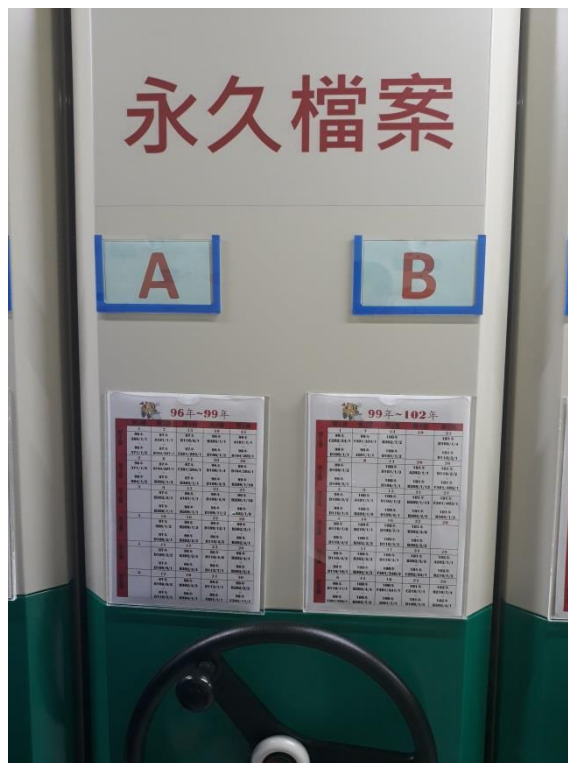
檔案架櫃外側清楚標示檔號存放範圍