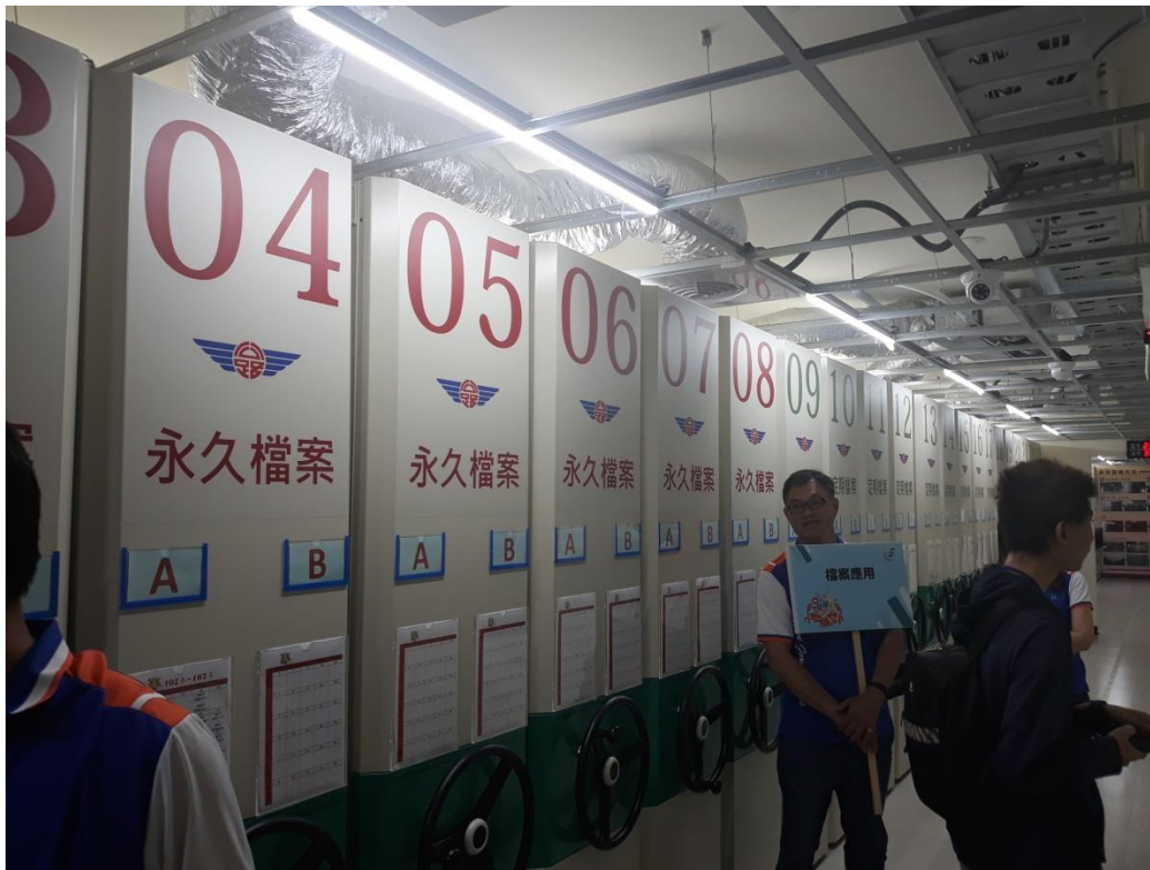
檔案架櫃外側清楚標示架號，並區分永久檔案及定期檔案