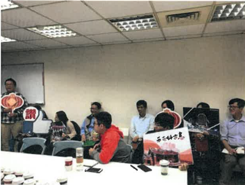
《點一下相片會更清晰呈現》