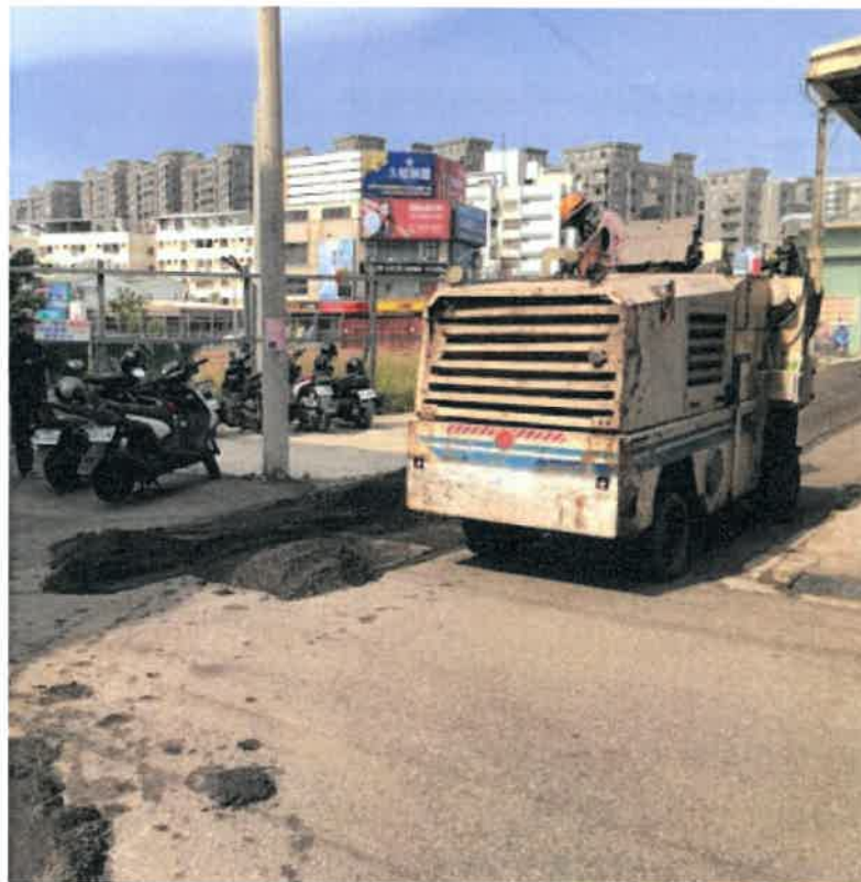
《點一下相片會更清晰呈現》