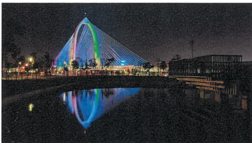
《點一下相片會更清晰呈現》

西屯區跨越環中路、台74快速道路連接中科路的位置，有一豎琴式斜張橋總長552公尺，鋼構主塔高約72公尺，雙向共4車道，載重依公路橋梁設計規範設計，每車道可承載活載重達302公噸重，並設置雙吊鎖安全回饋系統，是中臺灣最高的斜張橋，日前在夜間試燈非常醒目，已經成為高速公路、高鐵進入台中市的新地標。