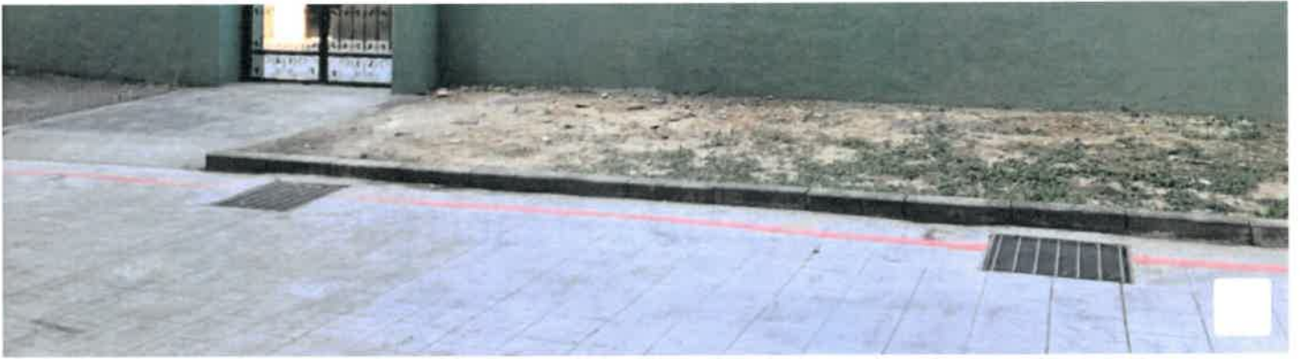
西屯區大鵬三村診療所。